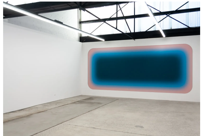
Subcult of the Sun, instalación de Jonny Niesche en Melbourne en 2022.