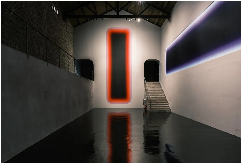
Total Vibration (Stardust Blue) en Nueva York en 2021.

Y se ve en su muestra de Ibiza. Los espectaculares degradados de las obras de Niesche, que transitan los colores del cielo con una cierta estética glam y en gran formato, son capaces de provocar esa exaltación romántica de la que él habla. “Mi trabajo es minimalismo hipnótico, incluso algún crítico habla de minimalismo pop”, apunta. Tras casi media vida pintando, Jonny Niesche ha saltado de técnica en técnica pasando por varios terrenos. “En mis primeros días experimenté con el realismo, el fotorrealismo, el expresionismo, el fauvismo y muchos otros estilos. Probé muchos sombreros”.