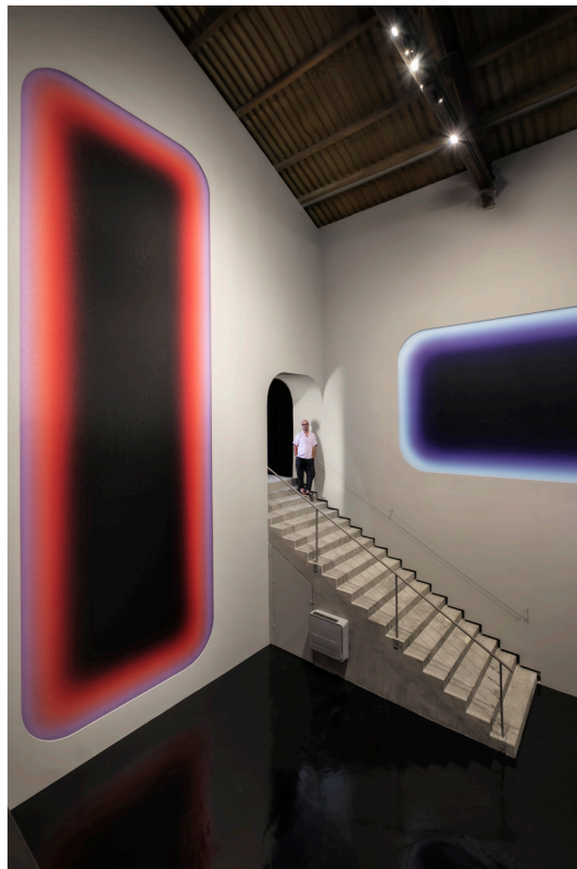
Niesche pretende ceder el protagonismo a sus obras.

❶ En Europa estamos inmersos en la guerra de Ucrania, una recesión económica y el cambio climático. ¿Qué le dice todo esto