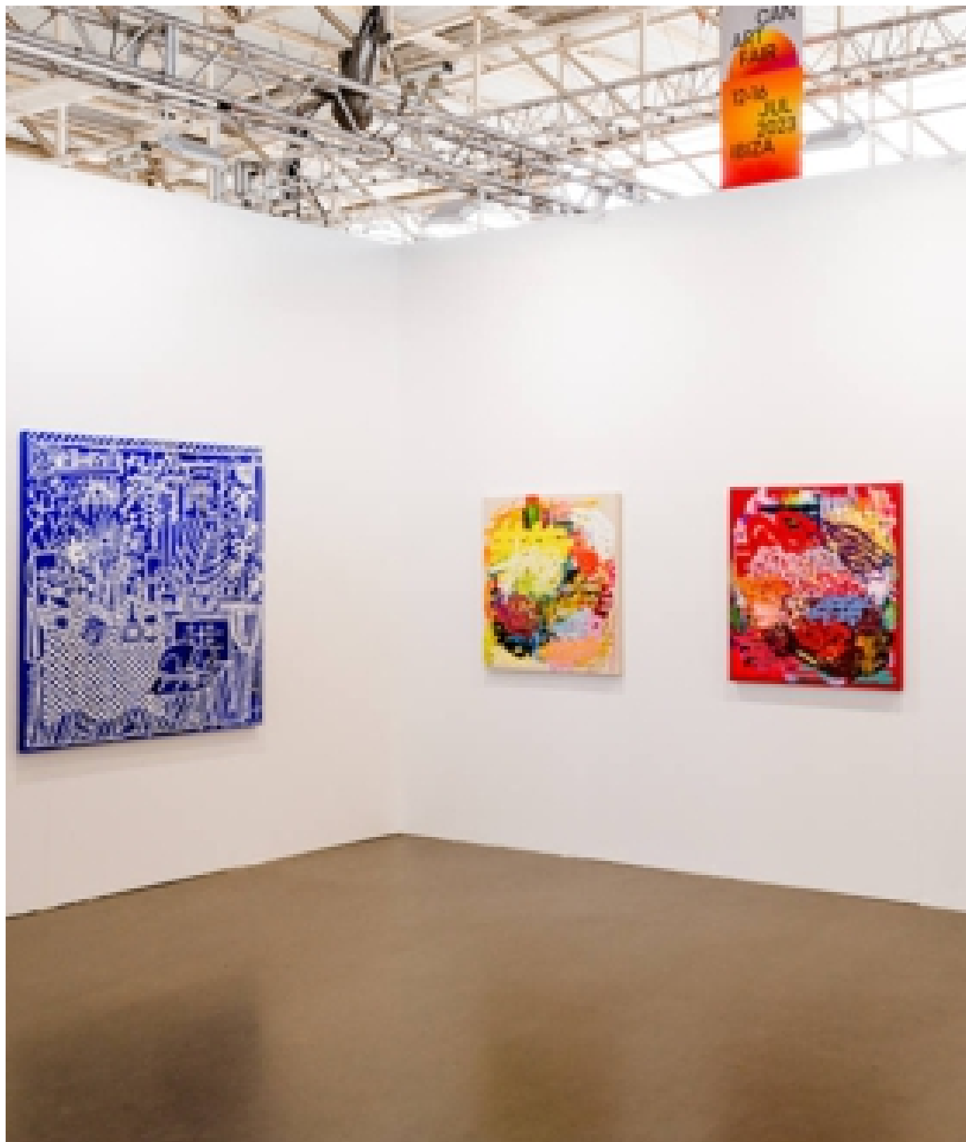
ESCENARIOS En la parte superior, instalación de Jonny Niesche en La Fundación La Nave Salinas titulada 'Ness'. Arriba, de izquierda a derecha, proyecto de la Orij Gallery para CAN Art Fair, y de WOAWGallery