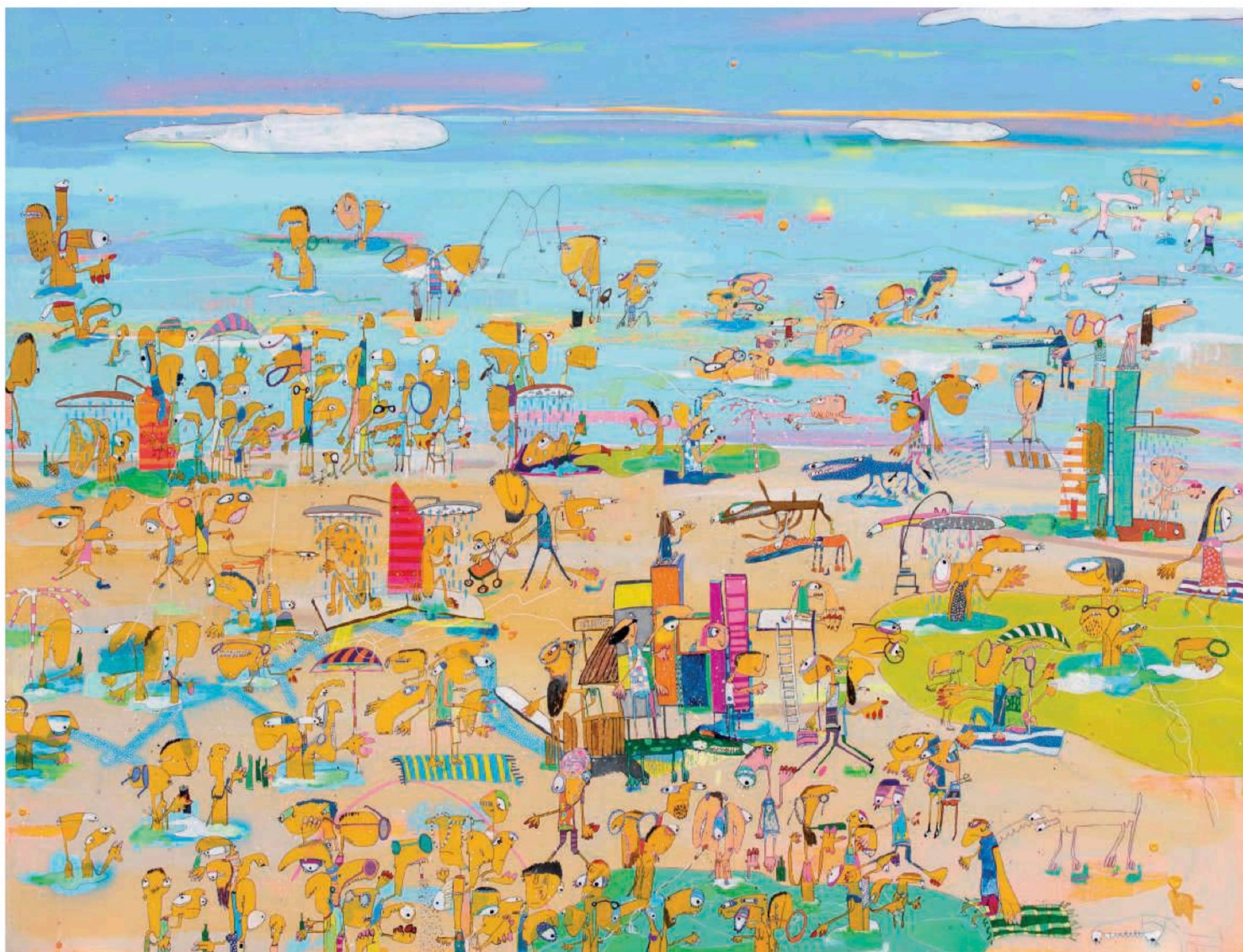
Sin título, 2021. Técnica mixta. 140 x 183 cm. Obra de la próxima exposición, El bañista, que se podrá ver durante el verano en la Fundación La Nave Salinas de Ibiza. Es el primer artista español que lo consigue tras Kaws, Keith Haring, Bill Viola o Kemy Scharf.

«CUANDO PINTO UNA PLAYA NUNCA PRETENDO INTERPRETAR BATALLAS ÉPICAS, TODO LO CONTRARIO, REFLEJO EL DÍA A DÍA DE UNA PERSONA FELIZ. ESTE TRABAJO GIRA EN TORNO AL MEDITERRÁNEO –COLOR Y VIDA A TOPE–. SU LUZ Y SU AZUL ESTÁN DENTRO DE TODOS NOSOTROS». RAFA MACARRÓN