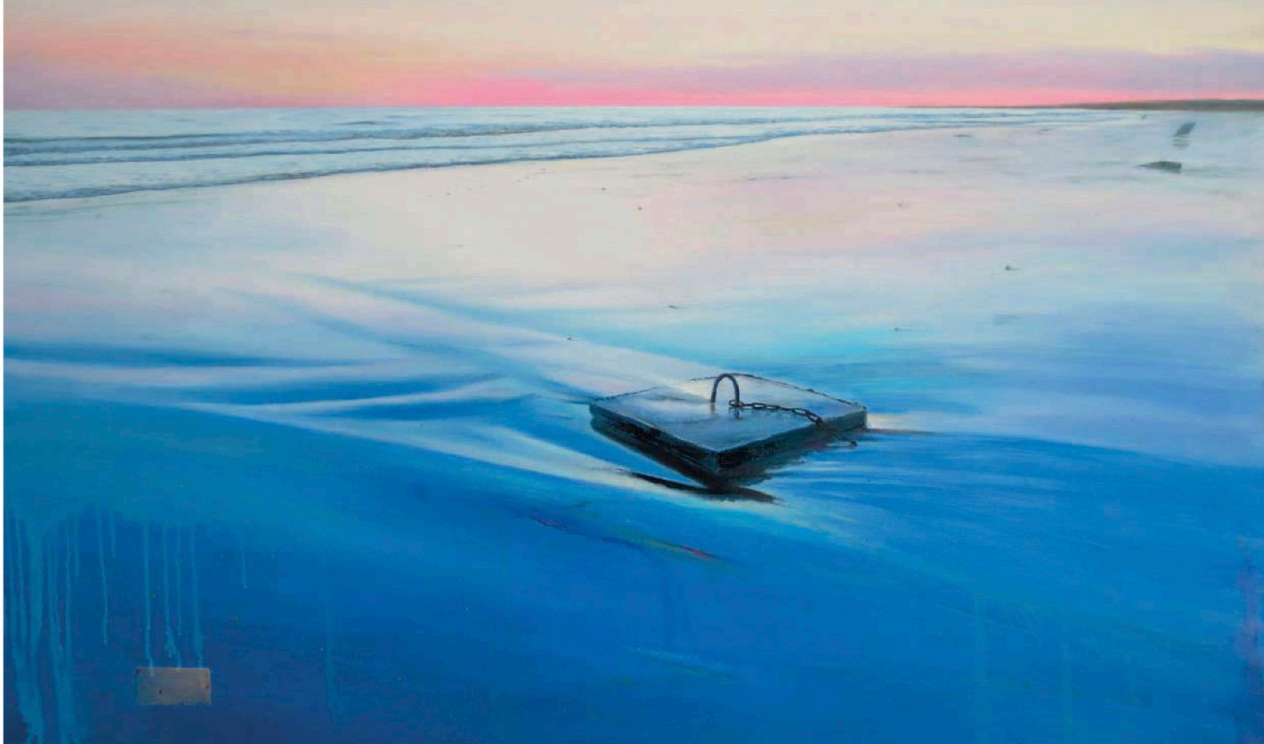
Hasta donde nos lleve la marea, 2021. Óleo sobre lienzo y encáustica. 130 x 89 cm, javiervarelart.com