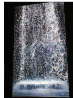
Las obras de Bill Viola en La Naves Salinas.

MacArthur Foundation Fellowship (1989). Además, el año pasado fue nombrado